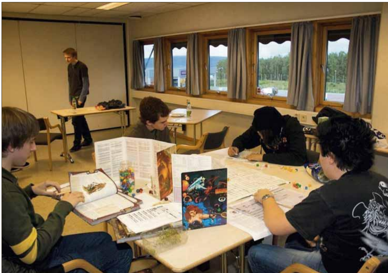
FORTAPT I SPILLVERDENEN: Kompliserte regler, tykke bøker og terninger i alle fasonger havner på bordet når Skedsmokorset Spillforening møtes hver onsdag.

– Rollespillene utvikler kreativitet og sosiale ferdigheter ved at man beskriver en fiktiv rolles utvikling i en historie som fortelles av flere mennesker på en gang, en unik måte å utfolde seg på som dessverre ikke er så godt kjent her i Norge. Vi er i tillegg et rusfritt alternativ for ungdom.