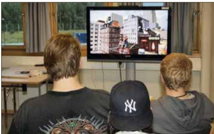
ELLER PS3: Er du lei av brettspill kan du ta deg en runde med Playstation.

– Foreningen er demokratisk, og er drevet av medlemmene selv, noe som byr på en utmerket anledning til å lære litt om hvordan man driver en organisasjon for dem som ønsker det, forteller Sæther, som håper flere vil ta kontakt og bli med i spillforeningen.